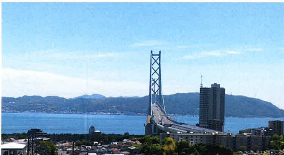
当院屋上からの眺め